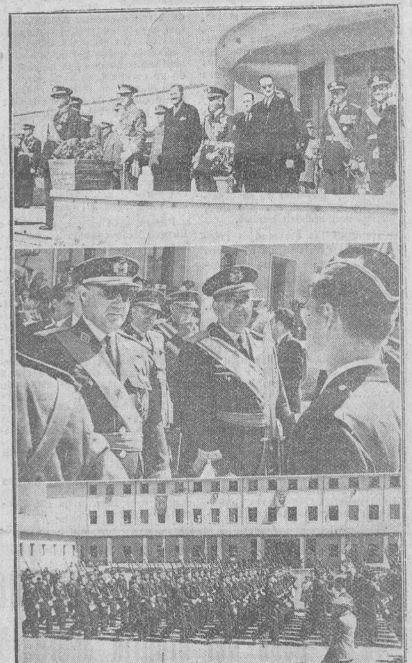
El ministro del Aire, teniente general González Gallarza, preside el domingo la entrega de despachos celebrada en la M. A. U. El ministro aparece en la primera fotografía presidiendo el acto, acompañado por todas las autoridades. En la segunda "foto" el hijo del ministro instantes antes de recibir su despacho como alférez eventual del Ejército del Aire. Al final figuran los caballeros cajetes en el desfile ante las autoridades.