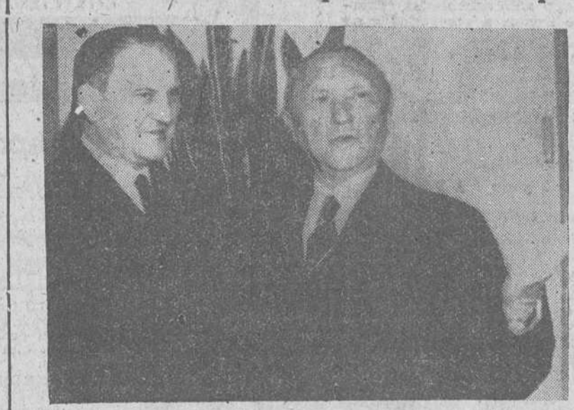
Bonn.— El ministro de Asuntos Exteriores, señor Castiella, durante la entrevista que mantuvo con el canciller de la República Federal, Dr. Adenauer, en Bonn.

Discurso de Castiella en un cena de gala ofrecida por su colega germano Von Brentano El ministro español visitó al presidente Luebke