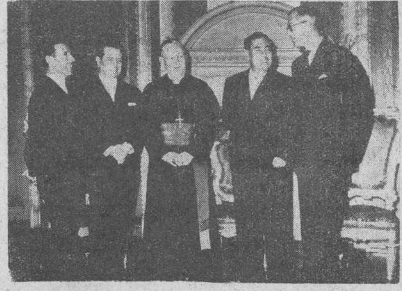
Periodistas españoles en Gran Bretaña

Los técnicos de la Administración Nacional de Aeronáutica y del Espacio, dispararon el proyectil desde la isla de Wallops (Virginia), a las 5,51 de la mañana (hora local), pero, en un comunicado facilitado después de realizado el experimento, se dice que no se produjo la nube de sodio prevista aunque se desconoce la causa del fallo.—Efe.