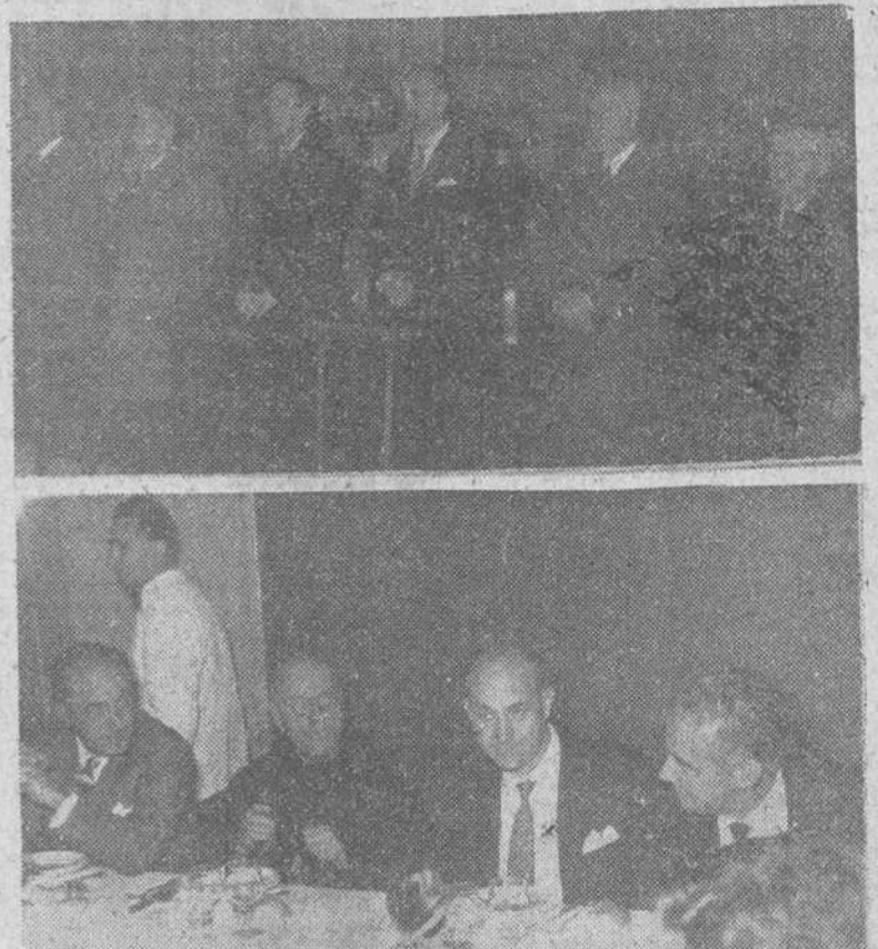
Con solemnes actos ha celebrado el aniversario de su fundación la "Mesa de Burgos" en Madrid. En el precedente grabado reproducimos sendas placas recogidas durante la ceremonia religiosa y el almuerzo de hermandad. (Información en quinta página)

Eisenhower será el segundo presidente norteamericano recibido por un Papa. Woodrow Wilson celebró una audiencia con el Papa Benedicto XV, el 4 de Enero de 1919.—Efe.