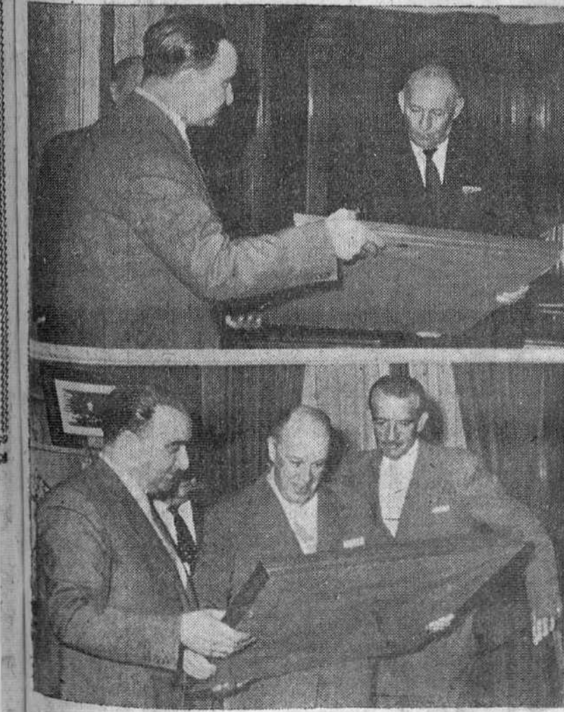
En un sencillo pero brillante acto celebrado el domingo, el Circolo de la Unión hizo entrega al capitán general de la región, teniente general Oliver Rubio y al gobernador civil de la provincia, señor Fernández-Victorio, de título de "socios de honor" con que ambas personalidades han sido recientemente galardonadas. En nuestro grabado, momento de la entrega de los respectivos pergaminos.