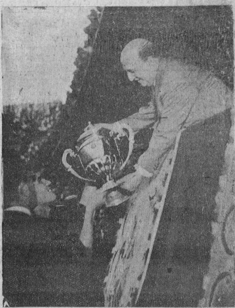
El Barcelona campeón de la Copa del Generalísimo