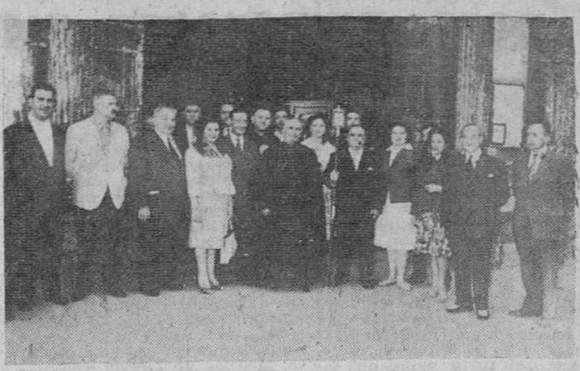
Con diversos actos celebró ayer su fiesta patronal, con motivo de la festividad de Santa Marta, el Sindicato de Hostelería. En nuestra página aparece un grupo de concurrentes a la misma celebrada, con tal motivo, en la iglesia de San Lorenzo.