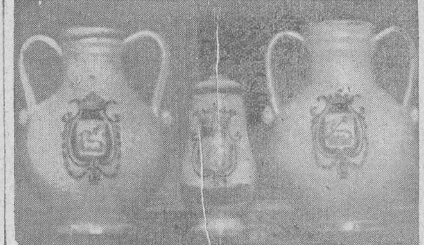
Jarrones y boté de Talavera, perteneciente a la antigua botica del Hospital de San Juan Evangelista, de Burgos.