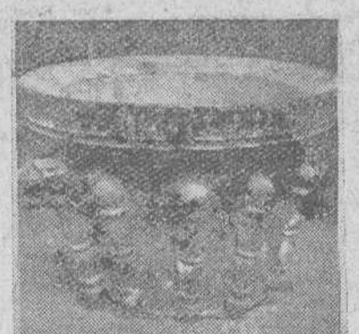
Mortero de plata y bronce perteneciente a la antigua Botica del Hospital de San Juan, de Burgos.

Una vez más lanzamos la idea de que este bellísimo conjunto tan íntimamente unido con la Historia de Burgos, pase a ocupar un lugar reservado del nuevo Museo Provincial, a semejanza de lo que recientemente se ha