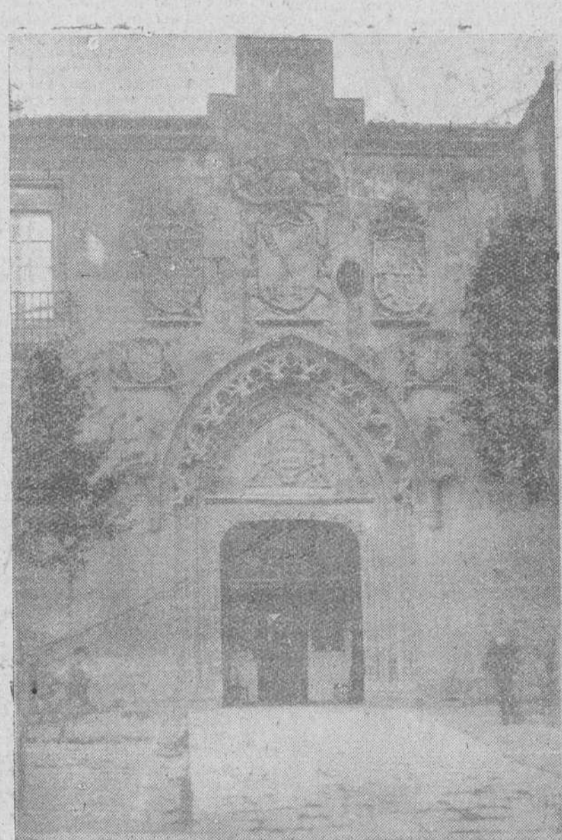
Portada de arco ojival guarnecido de calada crestería, del antiguo Hospital de San Juan.

El manuscrito titulado Directorio, regla y advertencias que se hacen a los abades que serán de este Real Monasterio de San Juan de Burgos, cita a Fray Es-