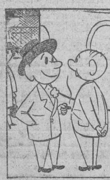
—Estupendo, chico; todo ayuda al fomento de la "afisión"