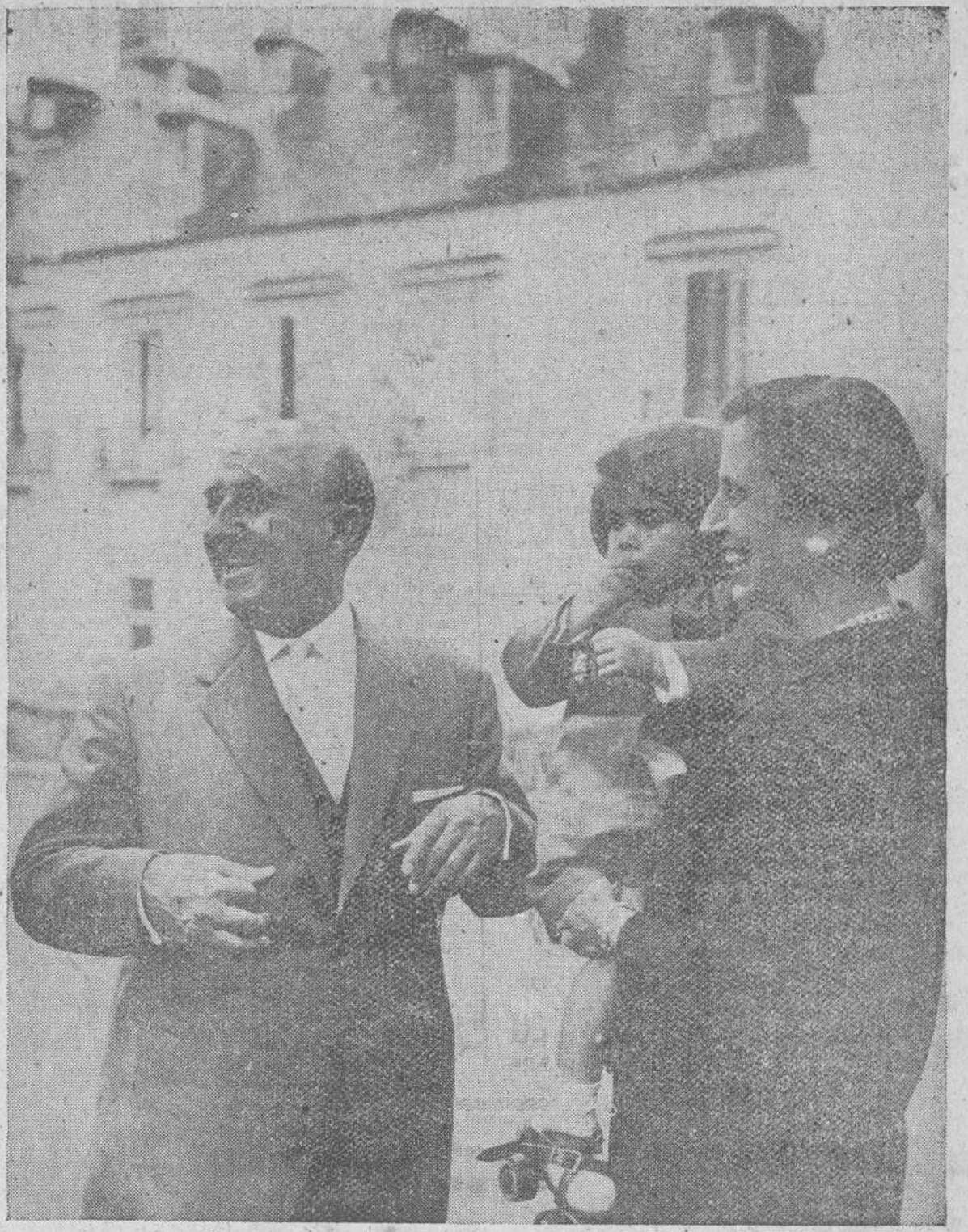
FRANCO ES FELIZ CUANDO SUS CINCO NIETOS LE VISITAN EN EL PALACIO DE EL PARDO, LA RESIDENCIA DEL JEFE DEL ESTADO ESPAÑOL. EL Y SU MUJER RIEN ABIERTAMENTE ANTE LAS DIABLURAS DE LOS NIÑOS.