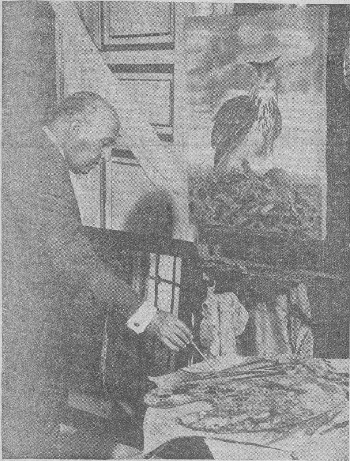
UNO DE LOS PASATIEMPOS DE FRANCO, JUNTO CON LA CAZA Y LA PESCA, ES EL DE LA PINTURA, COMO EL DE OTROS MUCHOS HOMBRES DE ESTADO, TALES COMO CHURCHILL Y EISENHOWER. EN LA FOTO LE VEMOS DEDICADO A SU PASION SEDENTARIA FAVORITA.