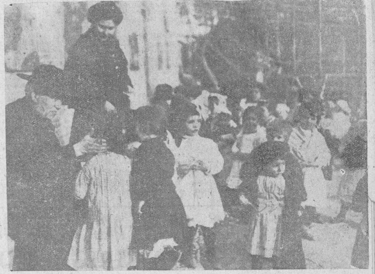
Una conmovedora estampa en la que se nos presenta al santo sacerdote y educador burgalés, rodeado de un grupo de gitanillos del Sacromonte granadino, símbolo de la niñez redimida en la Escuelas del "Ave María".

EN el año 1913 y en los talleres tipográficos de López de Guevara, en Granada, se imprimía la cuarta edición de una obra titulada "Derecho Eclesiástico General y Español" por D. Andrés Manjón y Manjón, canónigo de la insignie iglesia magistral del Sacro-Monte y catedrático de la asignatura de la Universidad de Granada."