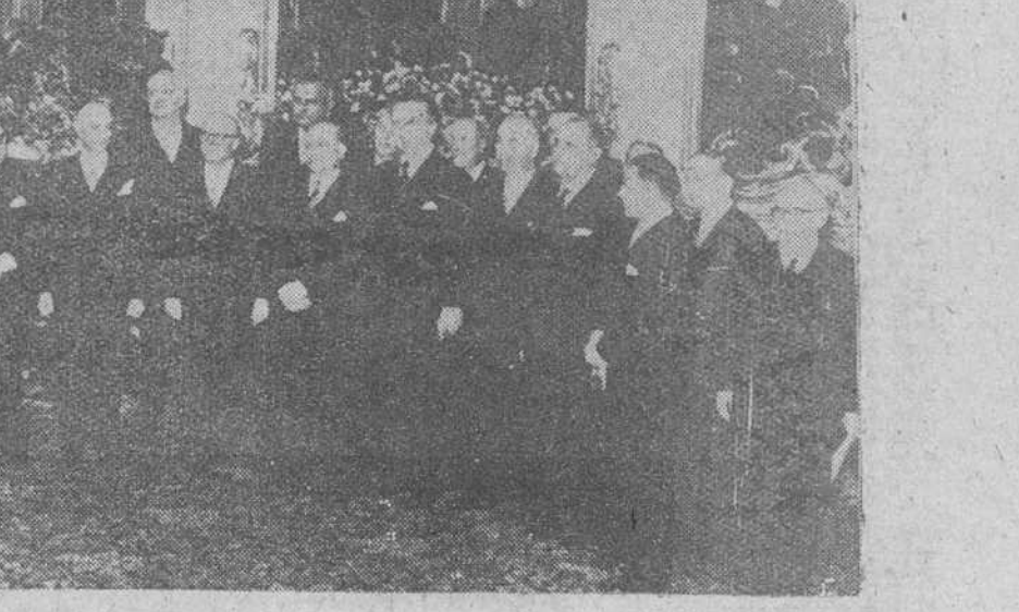
Roma.—El presidente de la República, Gronchi (en el centro), durante el acto de la presentación de los componentes del nuevo Gobierno italiano por el primer ministro, Segni.