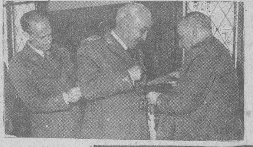
El capitán general de la Región, don Luis Oliver Rubio, ayudado del gobernador militar accidental, general Montoya, imponiendo el fajín, distintivo de su nuevo empleo, al general don Luis Fernández de Pinedo, coronel que ha sido hasta ahora del glorioso Regimiento de Infantería San Marcial número 7.

Bruselas.—Más de 50 mil mineros se han manifestado pacíficamente en la ciudad de Charleroi. Como garantía de que no estaban dispuestos a originar disturbios, los mineros eran acompañados de sus mujeres e hijos. Se está gestionando un intento de arreglo entre los dirigentes sindicales y los representantes del Gobierno y empresas. Los mineros han amenazado con ir indefinidamente a la huelga si no se atienden sus peticiones.