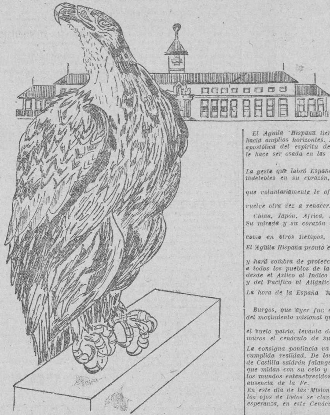
El Águila Hispana tiene su vista hacia amplios horizontes. La inquietud apostólica del espíritu de Javier le hace ser osada en las empresas de Dios.

Para dentro ya de España ninguna región como Burgos, ha de sentir soportar la responsabilidad inmensa, de seguir su ya bien marcada tradición misionera. A su entusiasmo, se debió en el siglo XVI el Convento de San Fabio, que enviaba misioneros a América, recientemente descubierta, y la que conquistaban hermanadas la Cruz y la espada. En ese mismo terreno que ocupaba antes el Colegio, se levanta ahora el Seminario Español de Misiones, Extranjeras, que quiere seguir en América y en el mundo entero la tradición misionera de España y que te pide a ti burgalés, una sola cosa para colaborar con él: en el día misional inscribirse en la Propagación de la Fe.