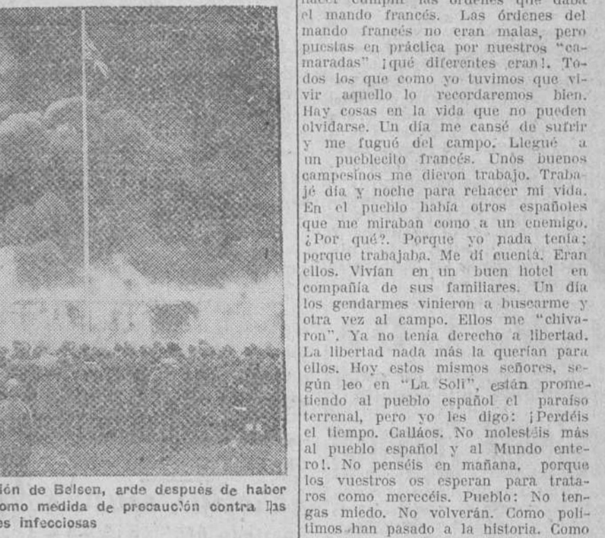
El ya histórico campo de concentración de Belsen, arde después de haber sido incendiado por los británicos como medida de precaución contra las enfermedades infecciosas