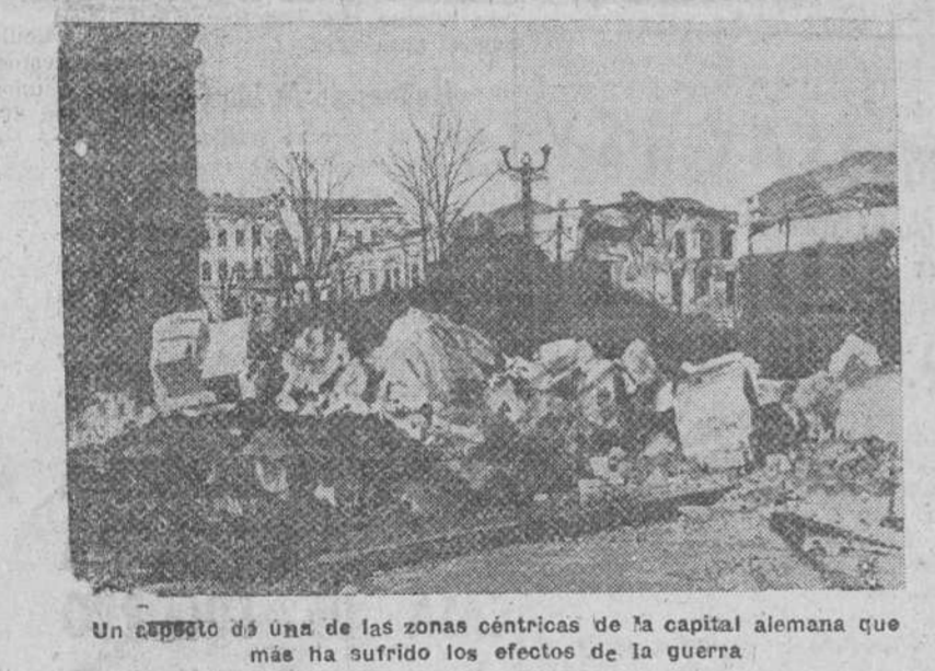
Un capitulo de una de las zonas céntricas de la capital alemana que más ha sufrido los efectos de la guerra