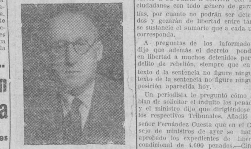
Don Tomás Suñer, nuevo subsecretario de Asuntos Exteriores que ha tomado posesión de su cargo