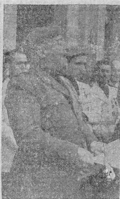
A la izquierda, S. E. el Jefe del Estado pronunciando su transcendental discurso en la sesión de clausura del Congreso Agrario Regional del Duero, que se ha celebrado en Valladolid.—A la derecha, el Caudillo dirige la palabra al pueblo vallisoletano desde el balcón del Ayuntamiento.— (Fotos S. O. F.)