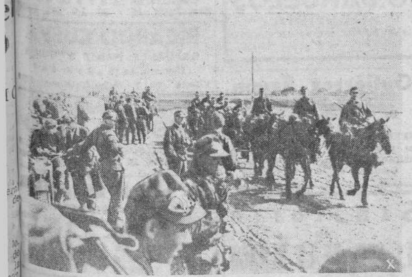
En marcha hacia un sector del frente Este, una patrulla de caballería alemana se cruza en el camino con una sección motorizada que descansa breves momentos al borde de la carretera, para reanudar después el regreso a los campamentos de retaguardia