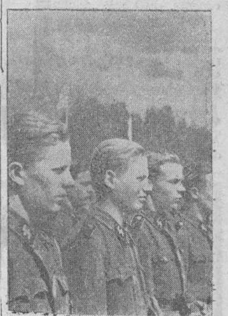
Constantemente se alistan nuevos jóvenes finlandeses para combatir al comunismo. Aquí vemos a un grupo de ellos, en el acto de la jura, verificado en Helsinki