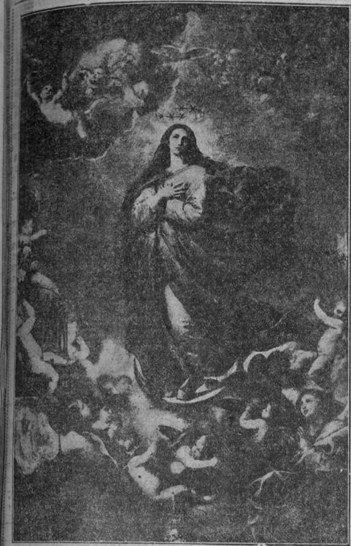
La Inmaculada, por José Ribera (Iglesia de las Agustinas, Salamanca)