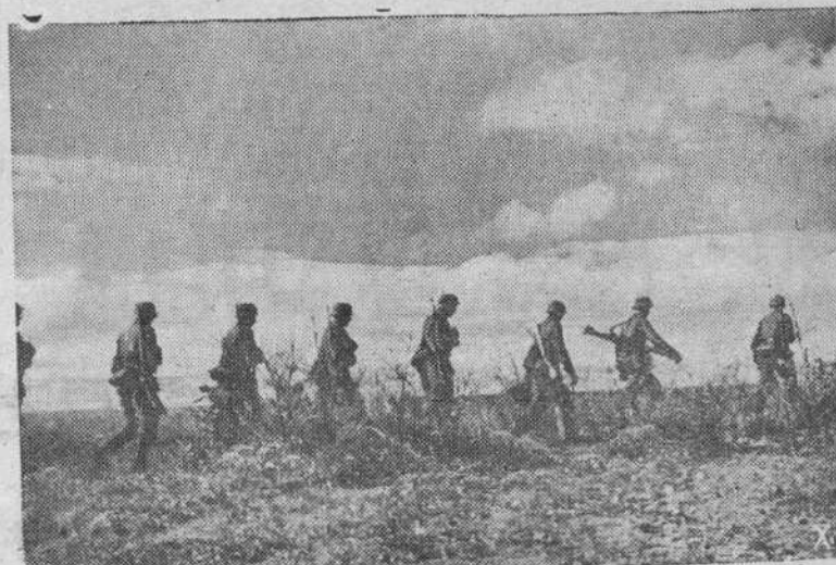
Una patrulla de infantería alemana, tras una operación en descubierto, vuelve a la segunda línea