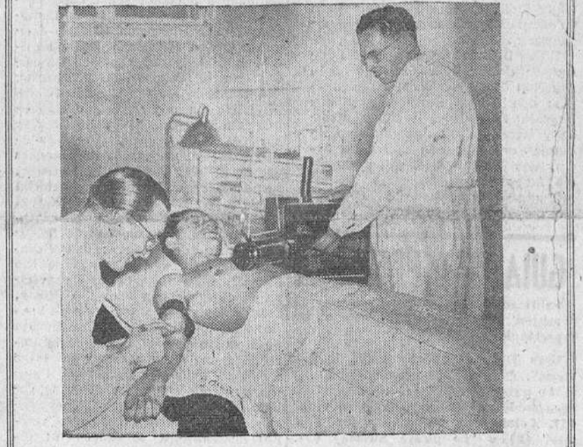
Substancias radioactivas, producidas en Gran Bretaña y enviadas por avión a Austria, son utilizadas en forma de inyección, para facilitar el diagnóstico en las enfermedades cardiacas.