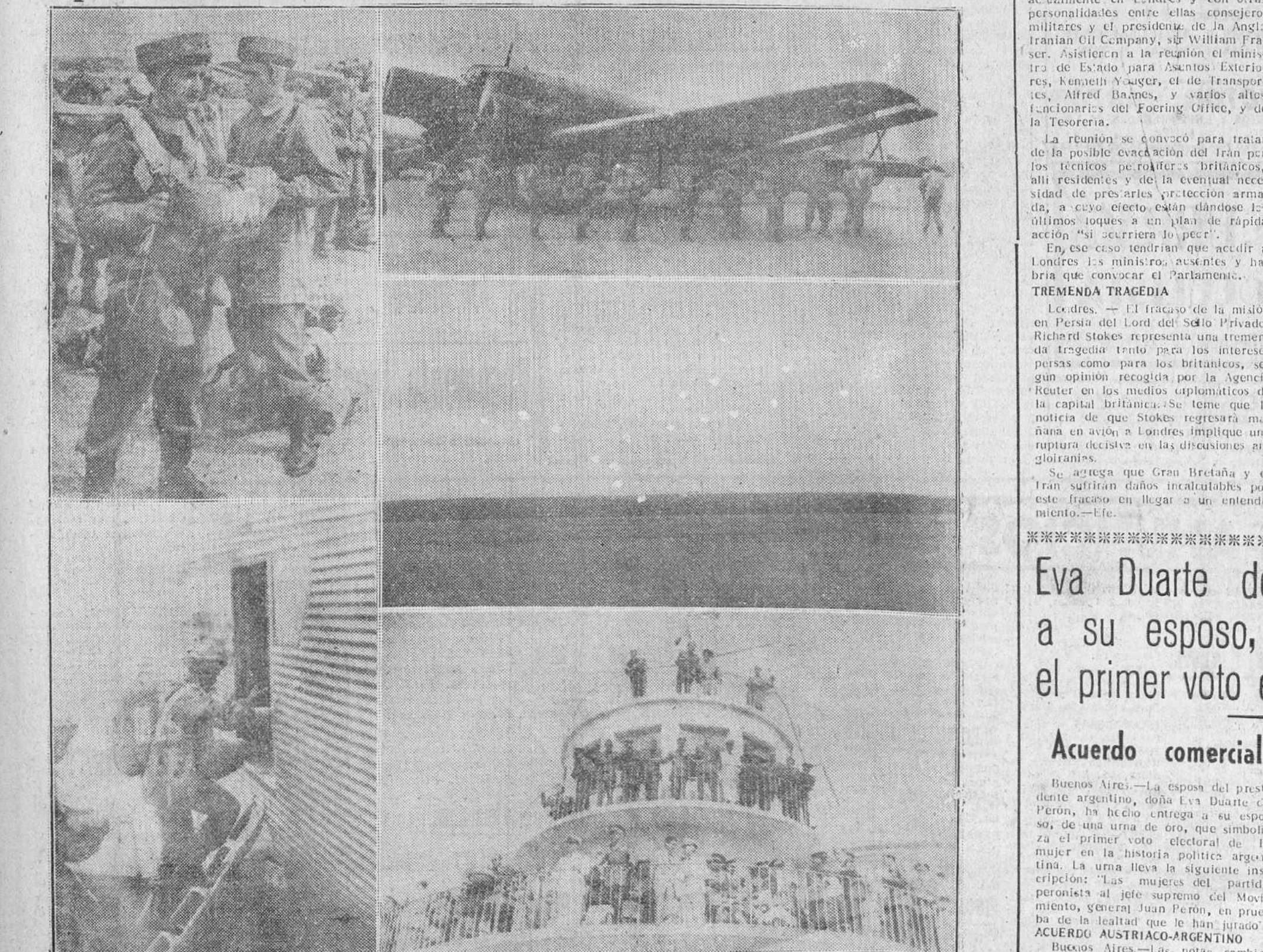
Ayer se efectuó, en el Campamento-Escuela de la Milicia Aérea Universitaria, un brillantísimo ejercicio táctico, con lanzamiento de paracaidistas. De dichas maniobras aéreas, cuya información publicamos en tercera página, ofrecemos el precedente reportaje gráfico de "Fece" que capta diversos momentos del espectacular ejercicio, presidido por destacadas autoridades y personalidades, las cuales aparecen en la última fotografía de la derecha, al pie del grabado.

Brillan tísimos ejercicio táctico, con lanzamiento de paracaidistas, en el campamento de la M. A. U.