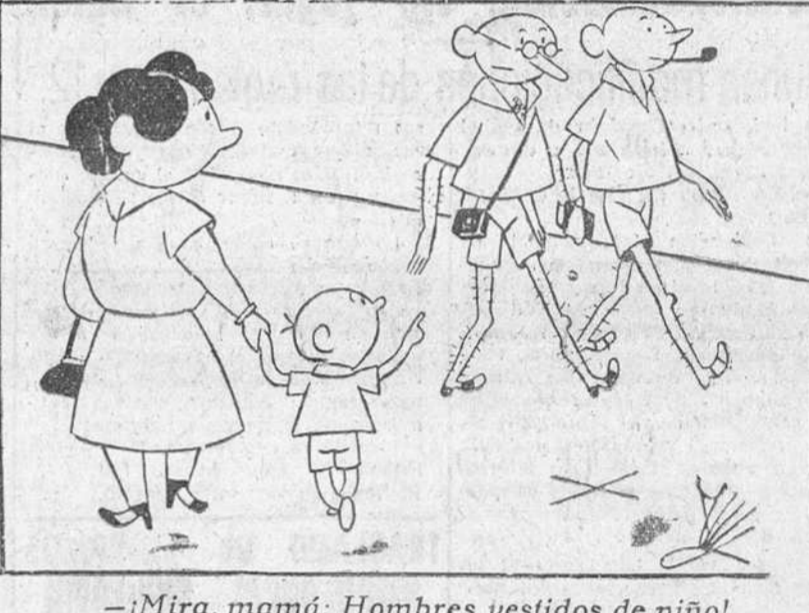
—¡Mira, mamá: Hombres vestidos de niño!