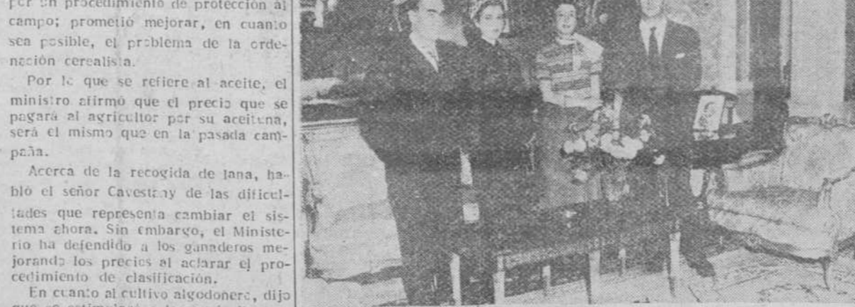
La Haya. — Los marqueses de Villaverde, don Cristóbal Martínez Bordiú y su esposa doña Carmen Franco-Pérez, fotografiados en los salones de la Legación de España en La Haya en compañía de los marqueses de Santa Cruz, ministros de España en Holanda, durante la estancia de los primeros en los Países Bajos.