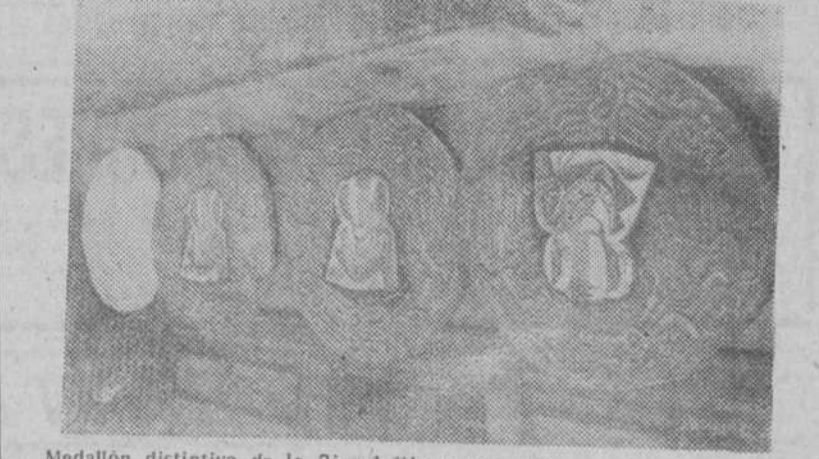
Medallón distintivo de la Bienal Hispanoamericana de Arte