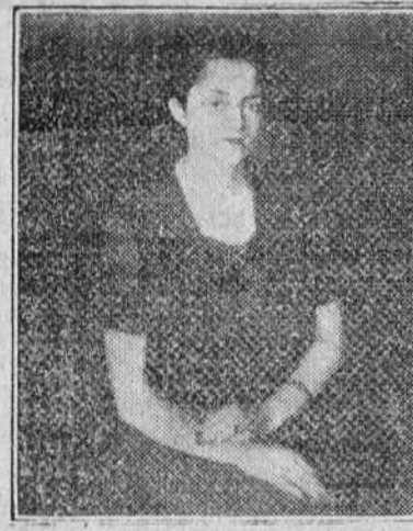
Modesto Ciruelos trabaja en la actualidad activamente, dedicado al retrato. La foto reproduce un reciente estudio, obra ejecutada de modo magistral y que demuestra el dominio que el notable artista burgalés posee de las más diversas técnicas y tendencias