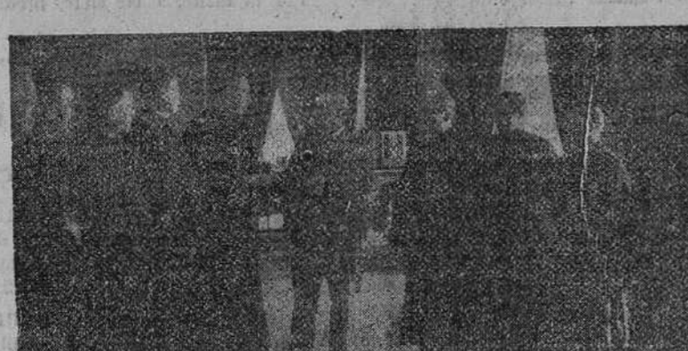
Madrid.—El Generalísimo con la Representación del Capitulo General de los Hermanos Maristas de algunos países hispano-americanos, que acudió a cumplimentarle.