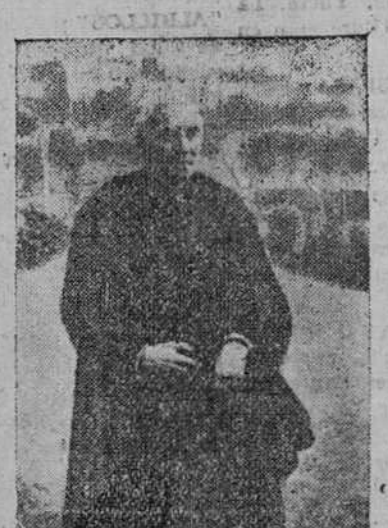
Parece ser --"nunca es tarde si la dicha es buena", dice el adagio castellano-- que va a cuajar en feliz realidad la idea de un homenaje a don Andrés Manjón, con motivo del I Centenario de su nacimiento, que se cumple el próximo día 30 del corriente.

Confesemos sin rubor que en esta ocasión hemos sido descuidados todos y por consiguiente, justo es que en la actual coyuntura pongamos cuanto esté de nuestra parte para que di-