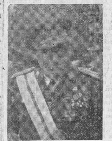
Culmina hoy, con una magna demostración deportiva, la gran Quinceañera celebrada en la Ciudad de los Deportes del "Dos de Mayo", en homenaje al teniente general Yagüe. Y el final de dicho Certamen, que no tiene precedentes en España, se celebra hoy, a base de un brillantísimo programa dedicado en su integridad, tanto en la composición del programa como en lo popular de sus precios, a que todo Burgos acuda a rendir tributo de admiración, gratitud y cariño a nuestro ilustre capitán general.

La fiesta dará comienzo a las siete y media de la tarde y se celebrará a base de precios populares