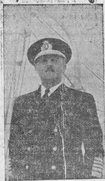
El teniente general Yagüe.

España sigue en pie, en pos de su Caudillo, con el espíritu que le llevó a su redención. Y ríde homenaje, en esta fecha, a Franco, artífice de la victoria en el 18 de Julio y al Ejército glorioso, que supieron hacer realidad las más nobles aspiraciones de la raza.