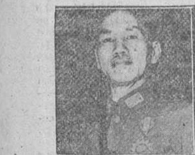
CHIANG KAI CHEK

Proclamas nacionalistas y comunistas para que se cumpla la orden de «alto el fuego»