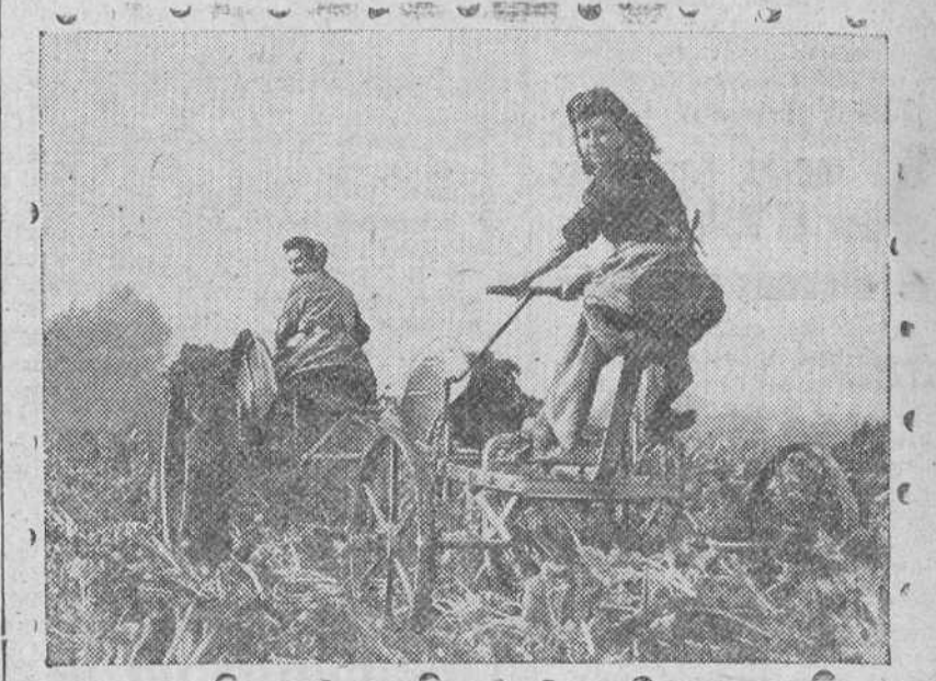
Muchachas del campo, ocupadas en la recolección de remolacha en Inglaterra