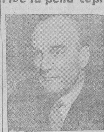
Lord Lawrence, presidente del Tribunal que juzga en Nuremberg a los criminales de guerra alemanes

Nuremberg.—La conciencia de las personas que sólo ayer fueron esclavizadas y torturadas en cuerpo y alma llama por encima de ésta para juzgar y condenar al más monstruoso intento de dominación y barbarismo de todas las épocas. Francia llevó casi en Mayo y Junio de 1940 el peso de los armamentos alemanes; pero mi país nunca dejó la lucha por la libertad y nunca estuvo ausente del campo de batalla. Francia fue sistemáticamente destruida y arruinada; por ello pide al tribunal en nombre de los heroicos mártires de la resistencia que se haga justicia. A través de mí, Francia se convierte en el intérprete de los pueblos martirizados de la Europa occidental, Noruega, Dinamarca, Bases Bajos, Bélgica y Luxemburgo. Con estas palabras dió comienzo la acusación francesa por boca de su fiscal, Francois de Menthon, en el proceso de Nuremberg contra los criminales de guerra alemanes.