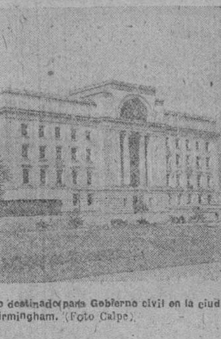
Una vista del magnífico edificio destinado para el Gobierno civil en la ciudad inglesa de Birmingham.