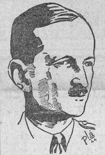
EL GENERAL LECLERC

"Es grave la situación pero no alarmante", dice Blum