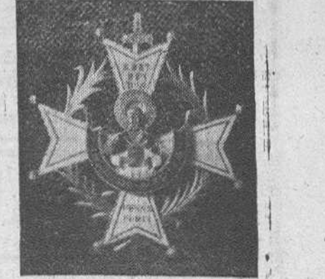
Cruz Meritísima de San Raimundo de Peñafort que hoy le será impuesta a nuestro Rvdmo. Prelado

En fecha tan señalada para la diócesis burguesa, DIARIO DE BURGOS se honra en elevar al ministro de Justicia el testimonio de la más cordial bienvenida por el honor que para-Burgos representa su estancia en nuestra ciudad. Y, al propio tiempo, patentiza a S. E. Rvdmo. la expresión de su respetuosa, enhorabuena adhesión, en nombre propio y en nombre de la renovada e inquebrantable de todos los burgaleses.