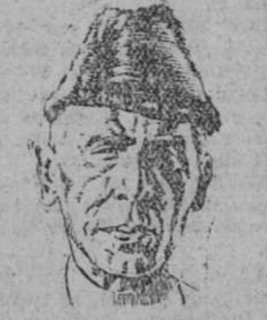
Mohamed Ali Jinnah

Washington. — Los Estados Unidos han firmado un acuerdo con El Salvador, mediante el cual se destacará una misión aérea norteamericana en este país por corto tiempo. — Efe.