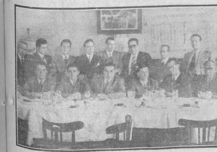
El domingo último, conmemoraron la fiesta de San Juan Ante-Portam Latinam, Patrona de las Artes Gráficas, los empleados y obreros de DIARIO DE BURGOS. Asistieron, primero, a una misa, en memoria de los compañeros fallecidos y, luego, se reunieron en una simpática fiesta de hermandad, consistente en una comida, servida con su exquisita habitual por el Parador "El Castellano". En la foto, un grupo de los concurrentes a ambos actos, presididos por nuestro director.