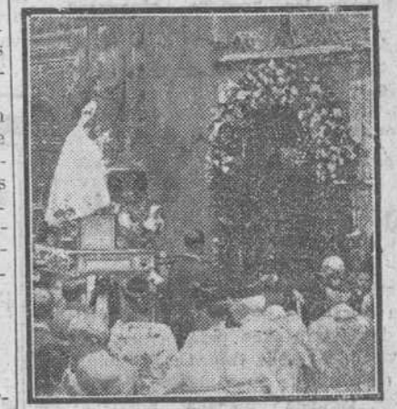
Un momento de la solemne procesión celebrada el domingo por la Cofradía de Nuestra Señora de la Alegría, en conmemoración de su festividad principal. La imagen de la Virgen, llega ante su camarín, en la calle de Fernán González.