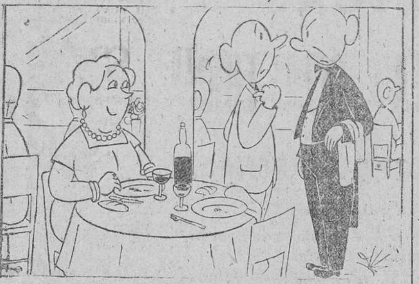
—Dice mi esposa que si el cocinero no tendría inconveniente en darle la receta de esos huevos que acabamos de tomar.