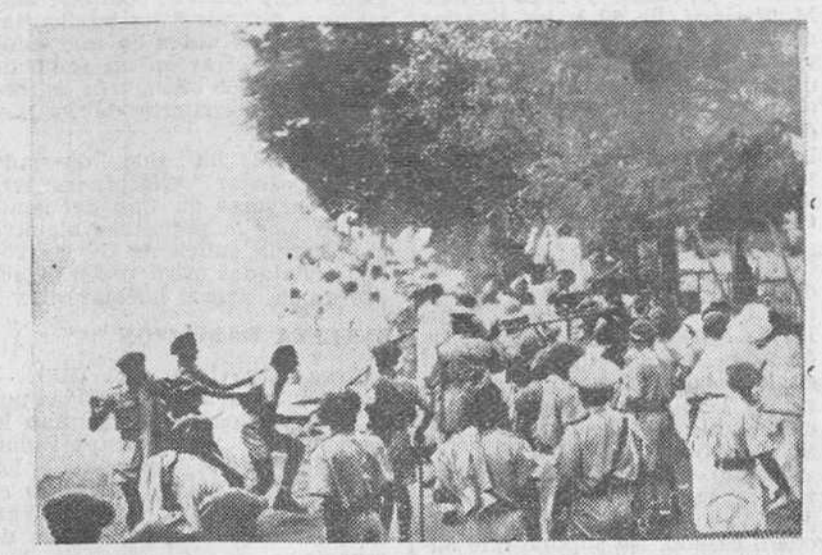
Los parias se manifiestan tumultuosamente en Madrás y dan origen a la violenta intervención de las fuerzas del Gobierno, como se aprecia en la foto.

El mercado de cambios más grande de los Estados Unidos; American Stock Exchange, el segundo mercado de valores del país, antes conocido por Bolsa de de Acero; Federal Reserve Bank, un Banco para Bancos, el más rico del Mundo, etc. —Y aquí, en este paraiso enorme del Stock Exchange, (el mayor mercado de valores extranjeros en los Estados Unidos) balizado de teléfonos, hormiguero humano, cuartel general de ventas y compras, ¿Es donde se libra la batalla del dinero? —En casi todas partes se libra esta batalla, pero aquí es donde su presencia constituye un espectáculo, rostros cejijuntos, dramáticos, gentes enloquecidas, hablan un idioma sin preposiciones ni conjunciones inútiles, directo, telegráfico, en el que no hay una palabra superflua. Es la lucha por el dólar. Pero en cifras ingentes. Acciones, obligaciones, dividendos y cupones, bailan su zarabanda terrible en esas cifras que hacen desfilarse ante el asombro del espectador en máquinas proyectoras.