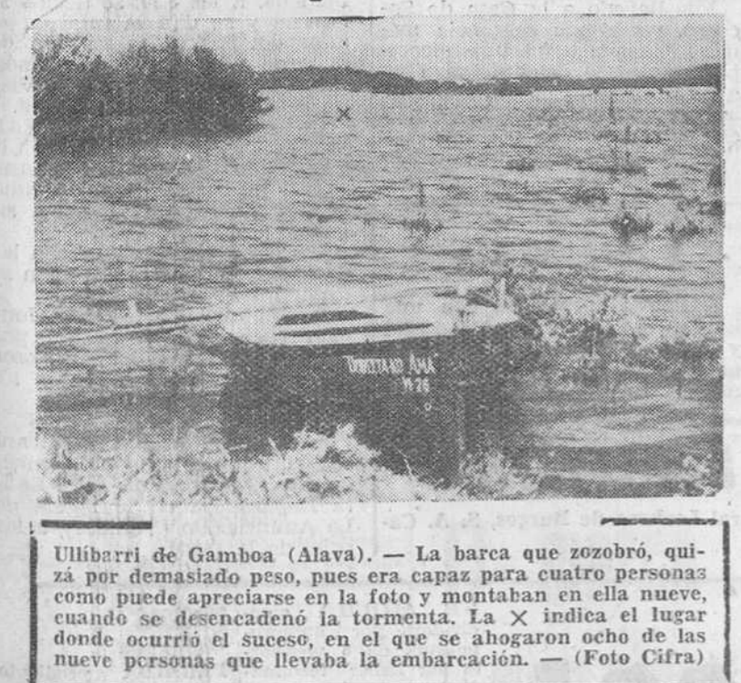
Ullibarri de Gamboa (Alava). — La barca que zozobró, quizá por demasiado peso, pues era capaz para cuatro personas como puede apreciarse en la foto y montaban en ella nueve, cuando se desencadenó la tormenta. La X indica el lugar donde ocurrió el suceso, en el que se ahogaron ocho de las nueve personas que llevaba la embarcación.