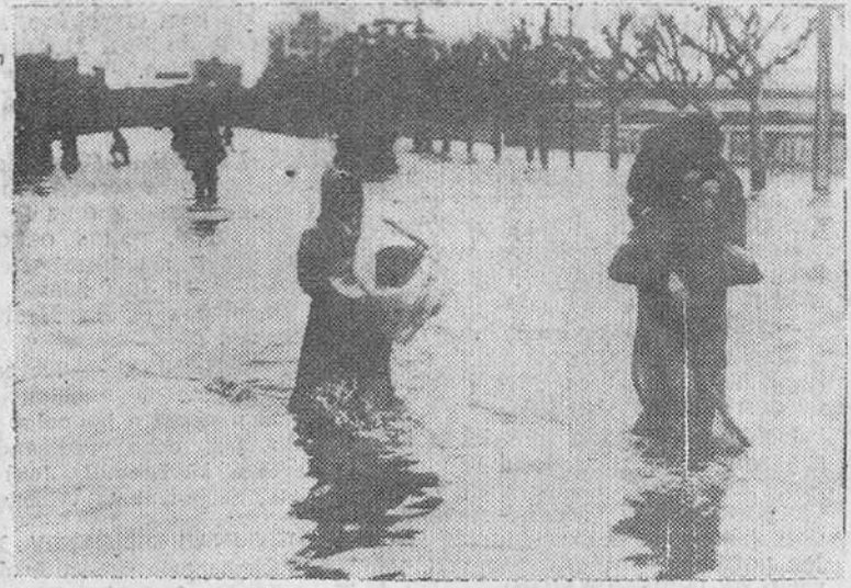
Buenos Aires. — Medio millón de personas han sido afectadas por las recientes inundaciones en esta capital y en otros puntos de la Argentina, que han sido consideradas como las peores desde hace dieciocho años. Son muchos los desaparecidos y se teme que haya muertos. Numerosas personas, como las que aparecen en la foto, han tenido que evacuar sus hogares, llevando en brazos a los niños y algunas de las ropas o enseres más necesarios.