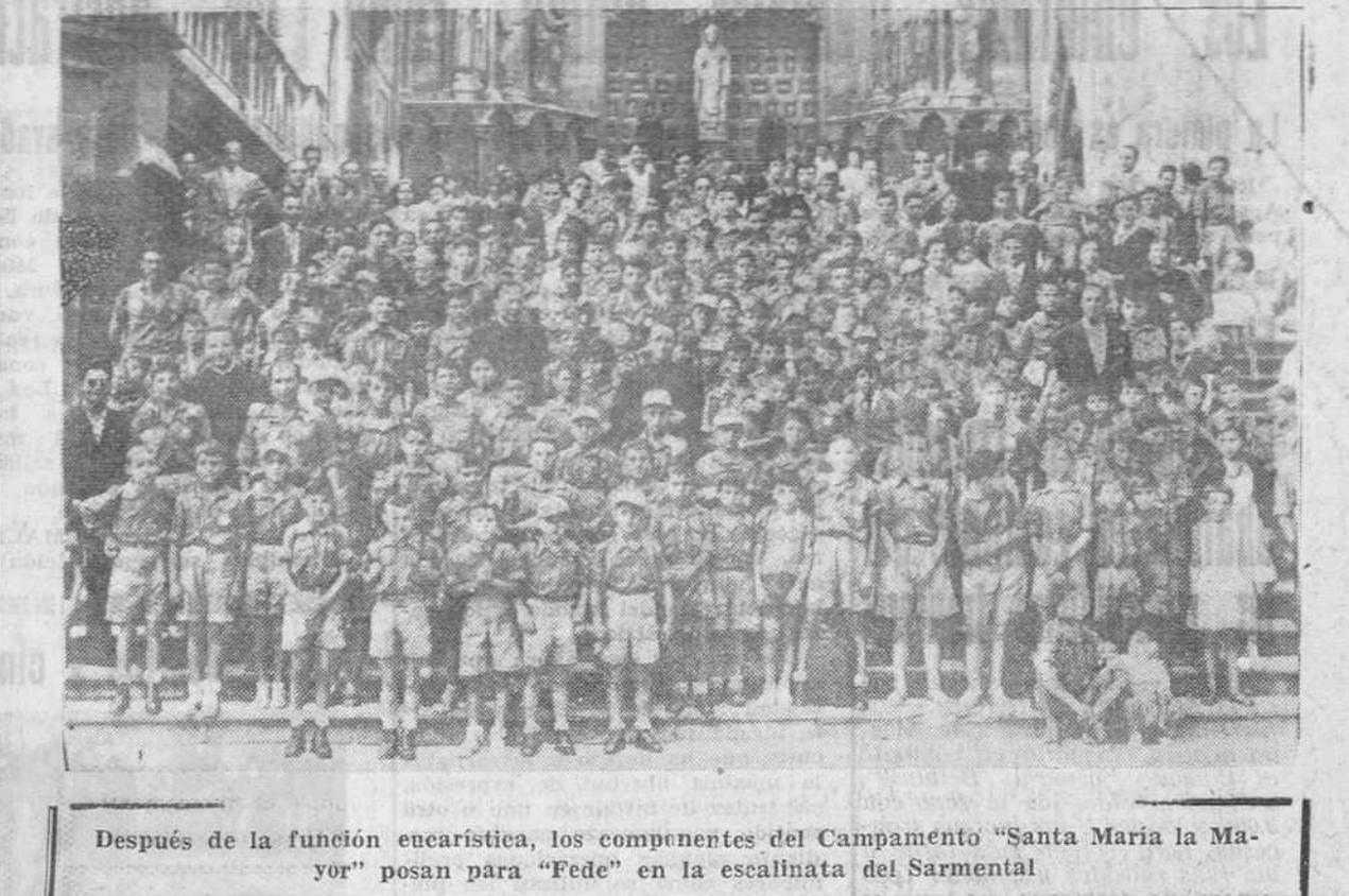
Después de la función eucarística, los componentes del Campamento "Santa María la Mayor" posan para "Fede" en la escalinata del Sarmental