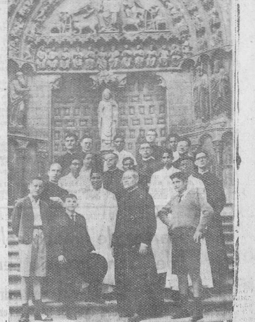
Hay se iniciará, con una solemne ceremonia en la Catedral, la XI Semana Misional. Entre los concurrentes a ésta figurarán varios seminaristas indios, que aparecen en el precedente grabado, a la salida de la Catedral, que visitaron ayer. (Información en quinta página)

Según ha expresado en unas declaraciones el subsecretario de Asuntos Exteriores, Bucetta, Marruecos aceptaría el funcionamiento de las escuelas francesas de Aviación con un fin estricto de enseñanza, pero Francia tendría que evacuar totalmente sus fuerzas, calculadas en unos 5.000 hombres. Por otra parte Bucetta señaló que esperaba tendrían resultado satisfactorio los medios puestos en acción por el Soberano marroquí para llevar a buen término la evacuación de las tropas destacadas en Marruecos.