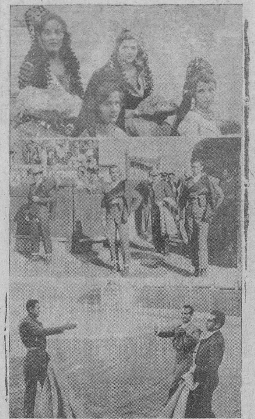
Con el esplendor acostumbrado, se celebró el domingo el XV festival taurino, organizado por la Asociación de la Prensa y DIARIO DE BURGOS, con el patrocinio de la Caja de Ahorros del Circulo Católico de Obreros, a beneficio del Asilo de Ancianos Desamparados. Del caritativo festejo ofrecemos las precedentes placas: en primer término, la Reina de la Prensa y su Corte de honor, en el grabado del centro los diestros antes de dar comienzo el festival y en el último plano, Jumillano, Pedrés y Joséillo de Colombia correspondiendo desde el tercio a las ovaciones del público, una vez terminada la lidia del tercer novillo.— (Fotos "Fede"). (Información del festival y lista de regalos, en cuarta página.)

Se celebró el domingo y fue presidido por la Reina de la Prensa y su Corte de honor