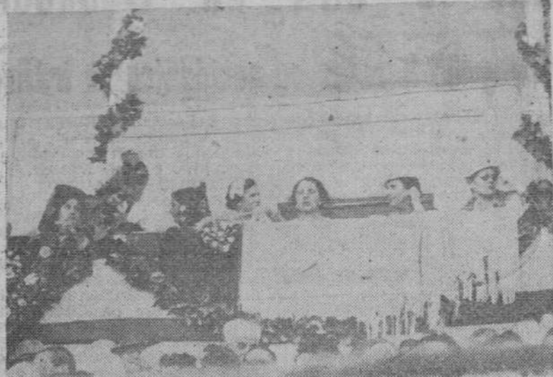
LAS DAMAS DE HONOR EN EL PALCO PRESIDENCIAL.

Organizado por la Asociación de la Prensa y DIARIO DE BURGOS, se celebró el domingo el XV Festival taurino a beneficio del Asilo de Ancianos Desamparados, con el patrocinio de la Caja de Ahorros y Monte de Piedad del Circulo Católico de Obreros.