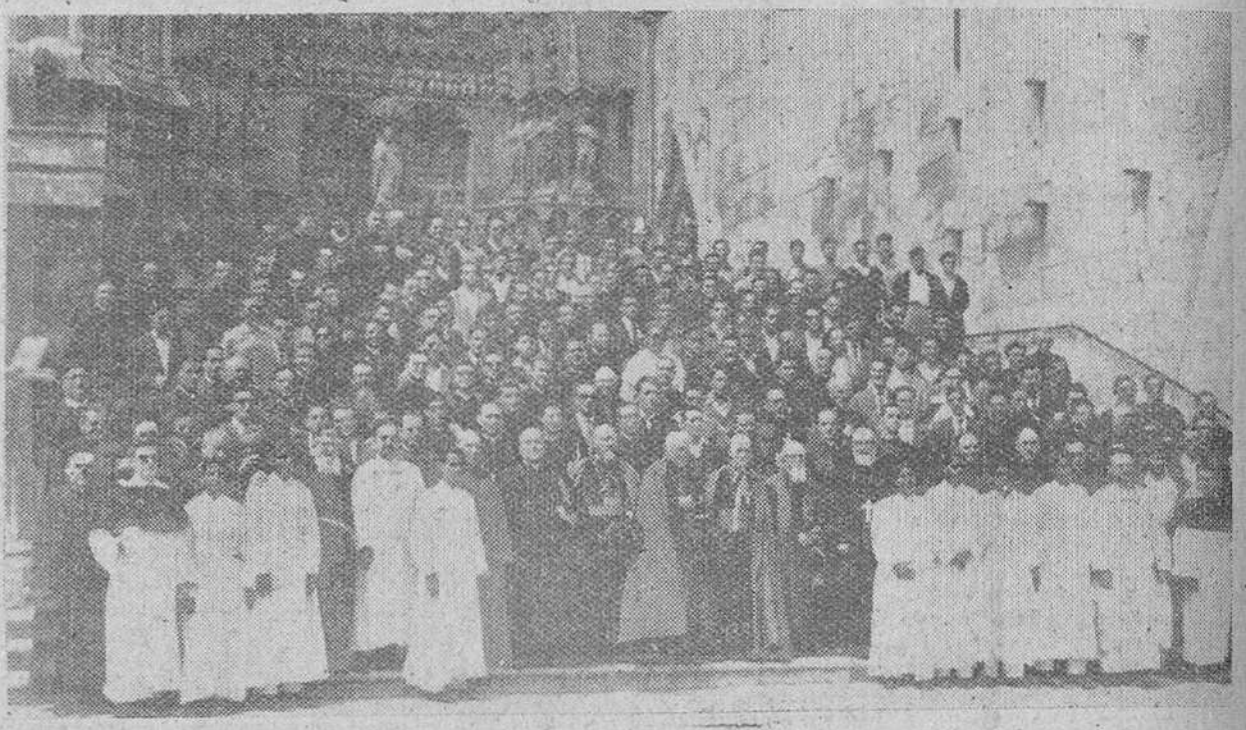
Los preladados misioneros y seminaristas que asisten a la XI Semana Misional de Burgos han girado una visita colectiva a nuestra incomparable Catedral. "Fede", obtuvo a la salida y ante la puerta del Sarmental el presente recuerdo gráfico