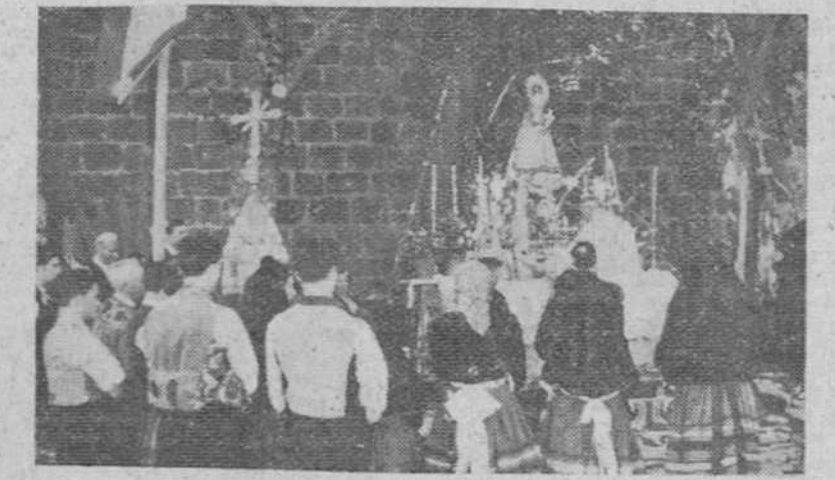
Se celebró el domingo, la tradicional romería típica que anualmente organiza el Orfeón Burgalés. A dicho acto pertenece la precedente fotografía de "Fede".