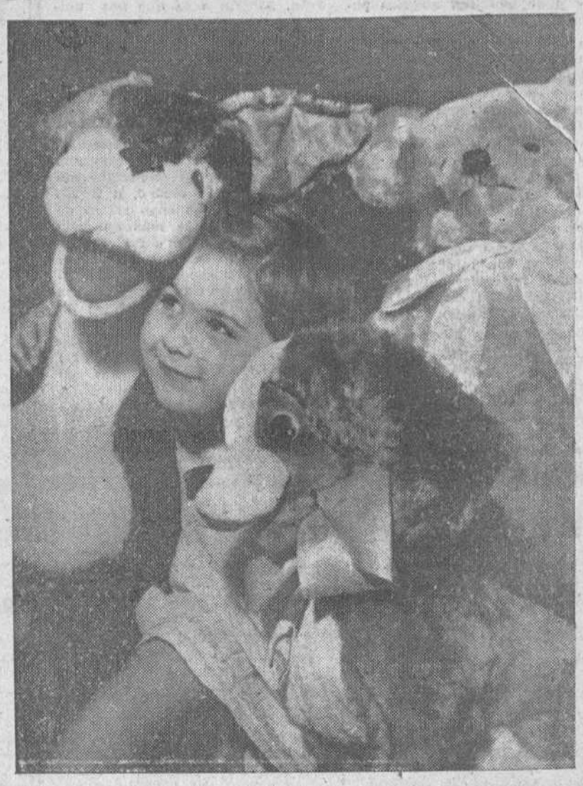
Sonríe ilusionada la niña, rodeada de sus juguetes, en el alegre despertar del Día de Reyes. La estampa es símbolo del gozo infantil, en la fecha importante y señalada del 6 de Enero. Escenas como ésta que ocupa el primer plano de nuestra página, se repetirán mañana en todos los hogares españoles, entre ruidosa algarabía de la grey infantil, dichosa con la contemplación y uso de sus juguetes preferidos