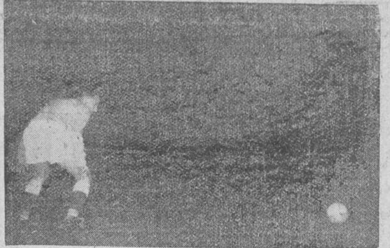
EL SEGUNDO GOL DE ESPAÑA, CONSEGUIDO POR KUBALA DE PENALTY EN EL PARTIDO CELEBRADO EL PASADO MIERCOLES EN MADRID.