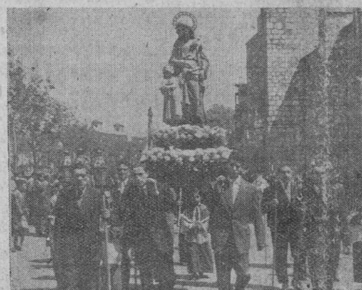
La imagen de San José durante su paso por las calles en la tradicional procesion del Circulo Católico de Obreros, que ayer celebró su fiesta principal.

(En segunda página: información de los actos celebrados en Burgos, con motivo de la fiesta de San José Obrero)