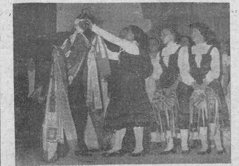
He aquí, captado por «Fede», el momento en que una señorita del Coro «Ronda Garelana», de Torrelavega, impuso en la noche del miércoles una corbata al estandarte del Orfeón Buralés, en el curso de la brillantísima audición musical organizada por el Centro Montañés de Burgos