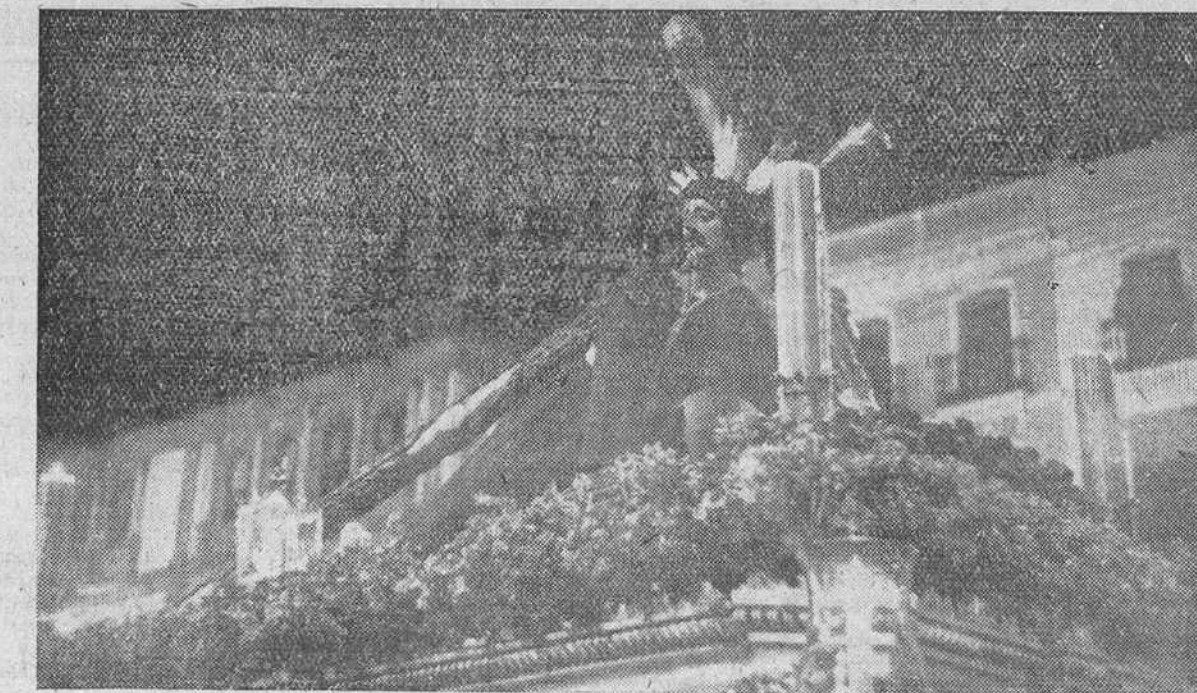
"CRISTO DE LAS PENAS", EN LA PROCESION DEL MARTES SANTO, EN SEVILLA

na Santa en las tierras del Sol y las flores, asume, en cambio, una grandeza trágica en Castilla. En Valladolid, donde está el Museo de las tallas religiosas, de los más lustres imagineros nuestros, como Berruguete y Montañés, las Procesiones son de un carácter impresionante, y magnífico. Es verdaderamente conmovedora la escena del paso, en Valladolid, al crepúsculo, de Cristo del Perdón, frente a la Cárcel donde, asomados a las rejas presidenciales y condenados a las máximas penas, se levanta