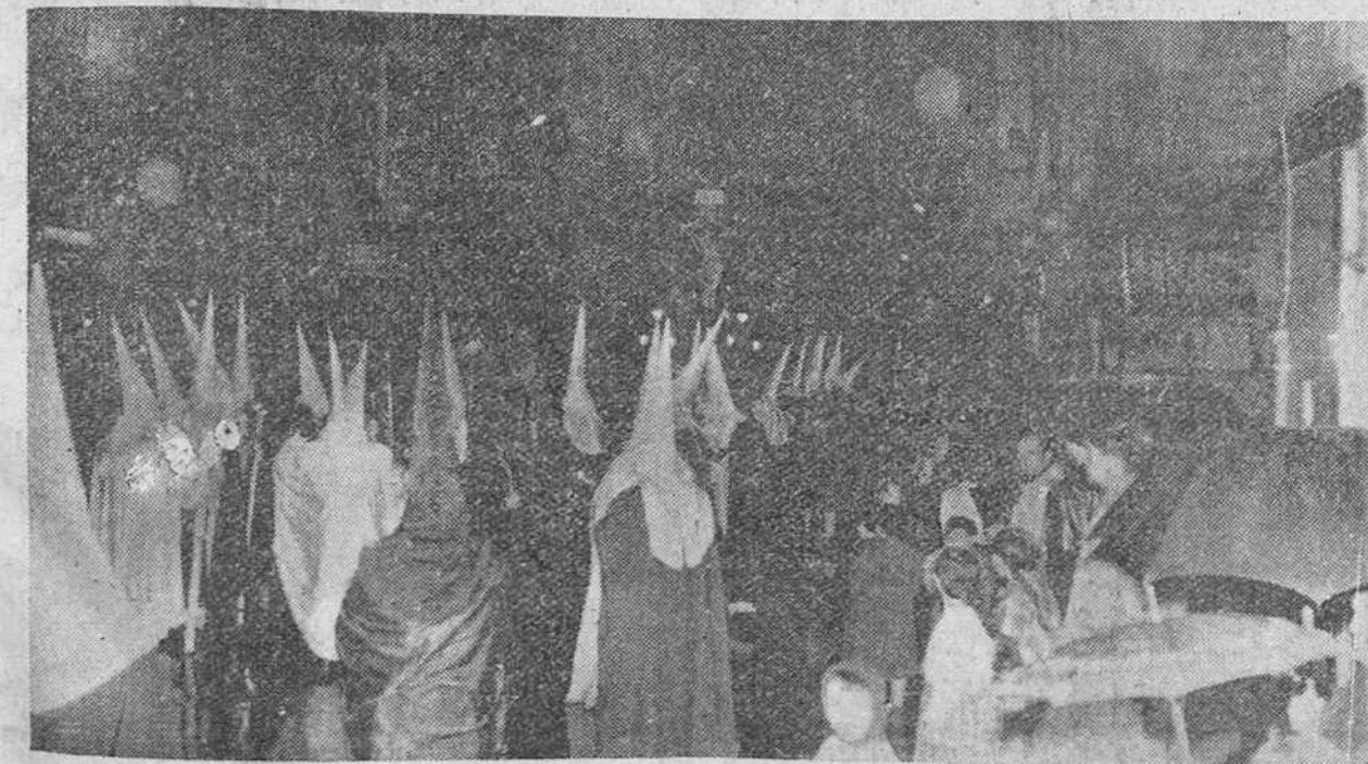
El Vía-Crucis penitencial de anoche

Sollihull (Inglaterra). — Un gas para cocinar no venenoso, cuya base es el petróleo y carbón en polvo, sustituirá al gas ordinario en todas las casas del país, afirma el doctor Frederick Dient, director de investigación del Consejo nacional del gas.—Efe.