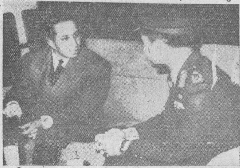
Amman (Jordania). — El Rey Faisal del Iraq (a la izquierda) conversando con su primo, el Rey Hussein de Jordania, en el curso de las negociaciones llevadas a cabo entre ambos soberanos de 22 años de edad, y en las cuales ha quedado consolidada oficialmente la unión de ambos países en un Estado federal.

Amman.— Jordania e Iraq se han unido oficialmente en un Estado federal, con un solo Gobierno central, un Parlamento, un solo Ejército, la misma política exterior y una sola economía. El Rey Hussein, de Jordania, y el Rey Faisal, del Iraq, ha firmado un documento oficial, en virtud del cual ha quedado proclamada la Federación. El nuevo Estado será llamado «Federación Árabe» y su Ejército, «Ejército Árabe». — Efe.