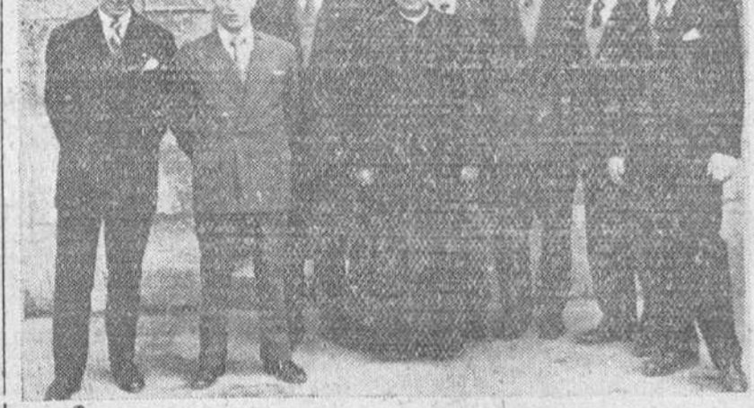
Hoy, iniciarán su viaje de fin de carrera los alumnos que constituyen la primera promoción de la Academia Universitaria de Derecho de Burgos. He aquí los futuros abogados, presididos por el reverendo P. Viana, director del mencionado Centro y que irá al frente de la expedición.