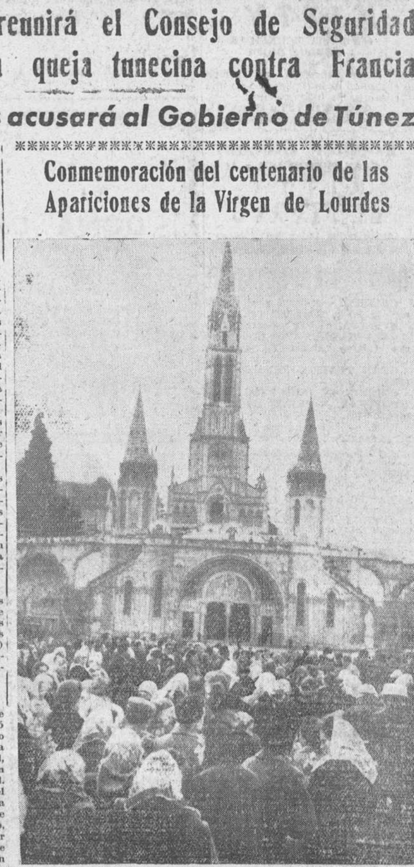
Lourdes. — El pasado día 11 se cumplieron los cien años de la primera de las Apariciones de la Virgen a Bernadette Soubirous en la gruta de Massabielle. Millares de peregrinos de todo el Mundo asistieron a las solemnes ceremonias celebradas. En la foto, un nutrido grupo de peregrinos ante la fachada principal de la basílica.

Más tarde recorrieron la ciudad camiones llenos de jóvenes que