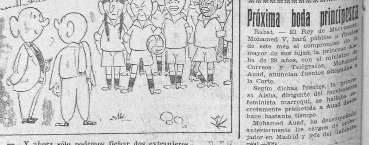
...Y ahora sólo podemos fichar dos extranjeros.