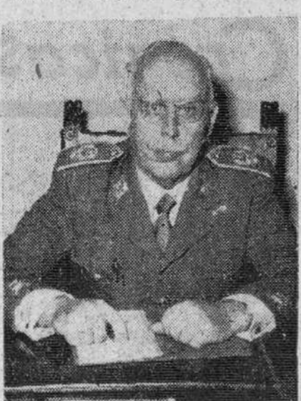
EL GENERAL YSASI-YASMENDI

Otro por el que cesa en su destino y pasa al grupo de Destinos de Arma o Cuerpo, el general de división