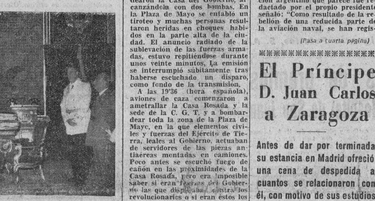
El Pardo. — Su Excelencia el Jefe del Estado con la promoción de secretarios de Embajada nuevos, acompañados del ministro de Asuntos Exteriores y del director de la Escuela Diplomática.