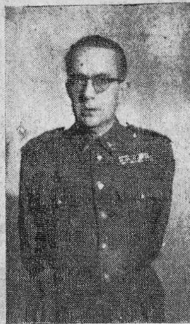
EL GENERAL IGLESIAS ASPIROZ

El actual, general Ysasi-Ysasmendi, ha sido nombrado jefe de Instrucción del Estado Mayor Central del Ejército