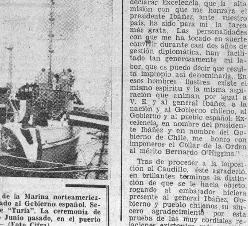
Nueva York. — El dragaminas de la Marina norteamericana MSC-130 que ha sido entregado al Gobierno español. Será bautizado con el nombre de "Turia". La ceremonia de entrega se celebró el día 1.º de Junio pasado, en el puerto de Nueva York.