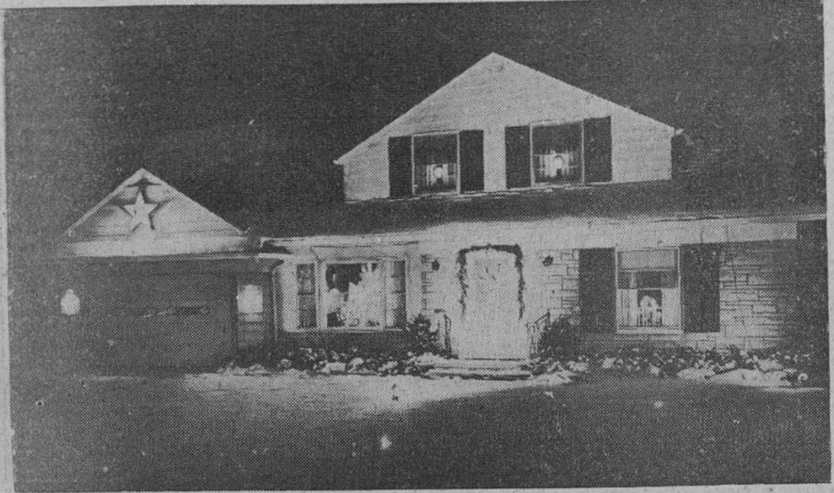
La llegada de las Navidades trae a las ciudades norteamericanas un torrente de luz. Los ingenieros del Instituto de Iluminación de General Electric en Nela Park, han ideado este año nuevos tipos de decoraciones luminosas para adornar las calles, los hogares, los árboles y los belenes. Alrededor de 500 millones de dólares se gastan los norteamericanos todos los años en decoraciones eléctricas.