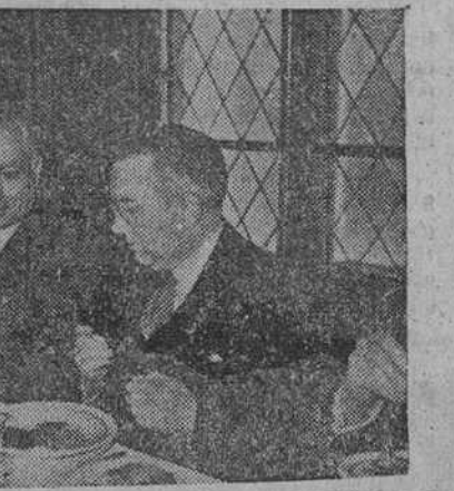
En vísperas de la Inmaculada, el Arma de Infantería inició ayer en Burgos su fiesta patronal y además de los festejos que tuvieron lugar en el Regimiento San Marcial número 7, se celebró en la Residencia militar un almuerzo al que asistieron los jefes y oficiales del Arma, presididos por el capitán general, teniente general Galera, a quien acompañaban los generales García Polo, de Infantería, e Iglesias Aspiroz, de Estado Mayor, conforme aparecen en el grabado, en unión de otros jefes.