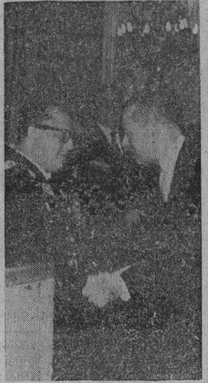
Caracas. — D. Blas Pérez González, felicitado al Presidente de la República, general Marcos Pérez Jiménez, con motivo del tercer aniversario de su subida al Poder.

Madrid. — El ministro de Obras Públicas en su habitual conversación con los periodistas les manifestó que había recibido la visita del alcalde de Madrid, quien le pidió facilidades para acometer algunas reformas en la Glorieta de Carlos V, que afectan principalmente a la parte de los jardines de acceso a la estación de Mediodía.