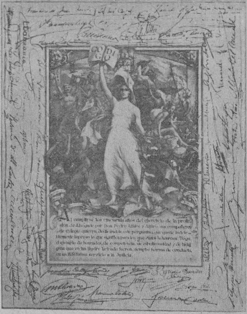
He aquí el bellissimo pergamino, confeccionado por el notable artista burgalés Fortunato Julián, obra que hoy será entregada, con las firmas de todos los abogados de esta ciudad al decano del Ilustre Colegio D. Pedro Alfaro Alfaro, como homenaje en la fiesta patronal.