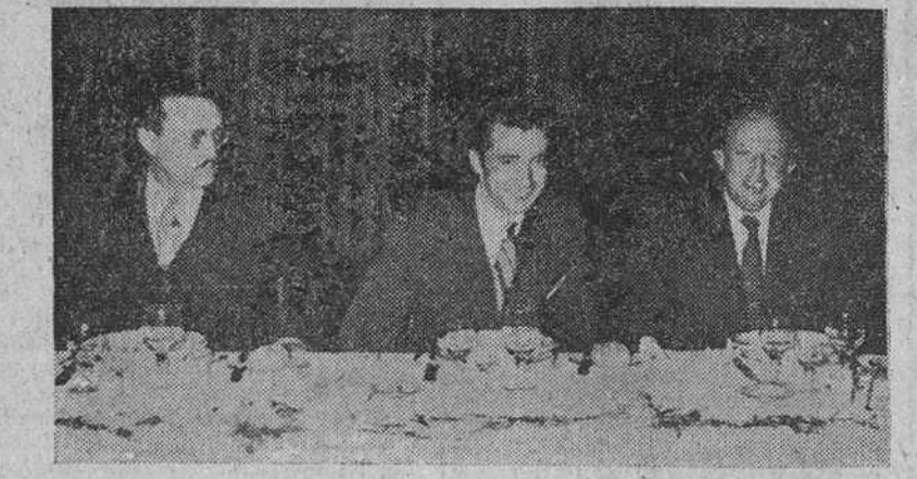
He aquí la presidencia del homenaje al diestro burgalés Rafael Pedrosa, durante la fiesta que le fue ofrecida anoche en el Hotel Condestable. Junto al valiente matador puede verse al alcalde de Burgos y al presidente de la Peña que lleva el nombre del torero de Villatoro. —(Foto Fede).