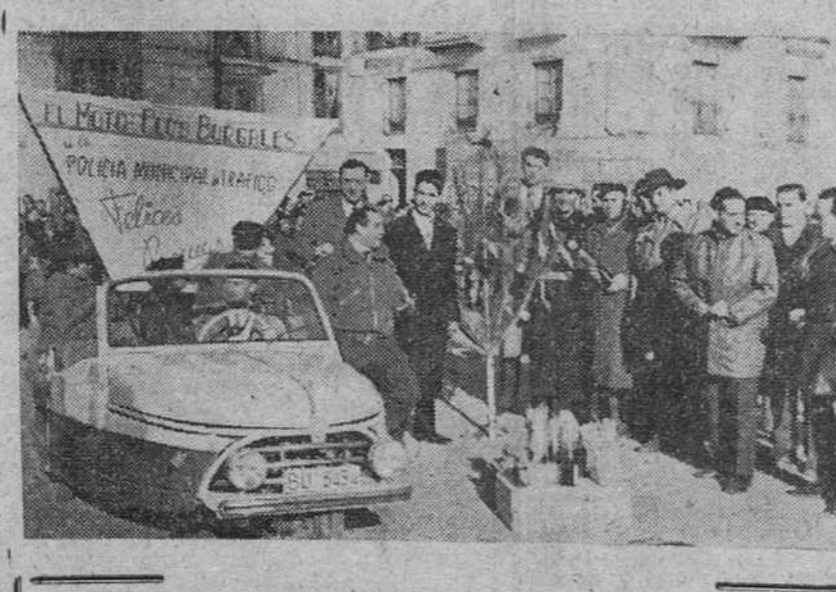
He aquí un momento de la entrega de aguinaldos a los agentes municipales de la Circulación en Burgos, simpático gesto tenido por los burgaleses en la fiesta de Navidad, gracias a la iniciativa del "Moto Club Burgales".