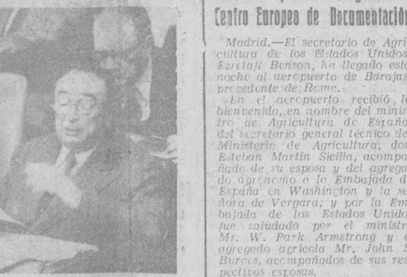
Madrid. — El secretario de Agricultura de los Estados Unidos, Ezra Taft Benson, ha llegado esta noche al aeropuerto de Barajas, presidente de Remo.

Debate sobre el desarme en la comisión política principal de la Asamblea de la ONU