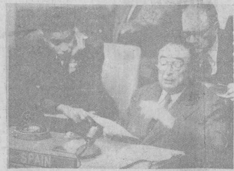
Nueva York. — El embajador de España en la ONU don José Félix de Lequerica, durante su discurso sobre el desarme en el debate que celebró la Comisión Política principal de la Asamblea General de la ONU el pasado día 5.