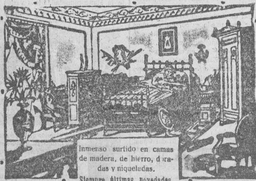
Imenso surtido en camas de madera, de hierro, de raudas y niqueladas. Siempre últimas novedades.

Calle de Vitoria, número 14.—BURGOS. En esta Casa se vende el sommier "Numancia"