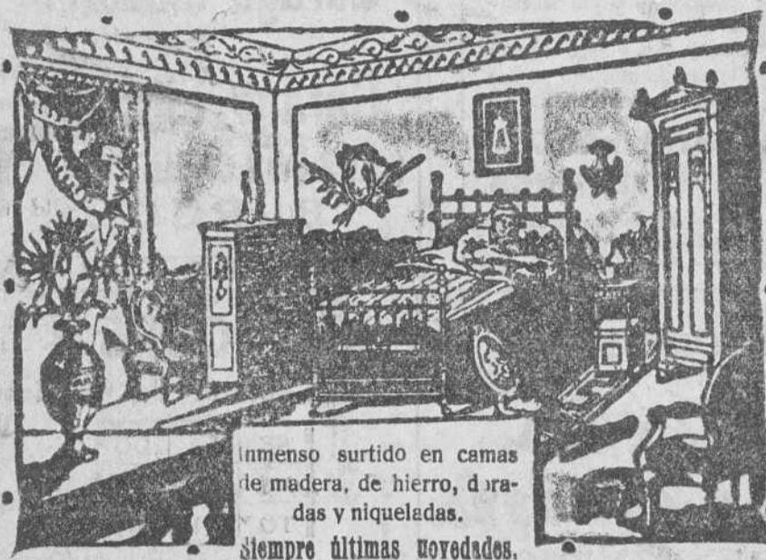
Ves el nuevo sommier, todo hierro, modelo patentado. Es muy limpio, fortísimo y muy económico

¿Quiere comprar camas y muebles de toda confianza a precios baratísimos? Visite la Gran Bretaña en Burgos