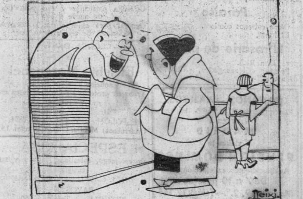
—Me manda la señorita que le diga a usted que las judías que le hemos comprado, todas se enciellan. ¡Ah! No tiene nada de particular. Es que son de El Burco.