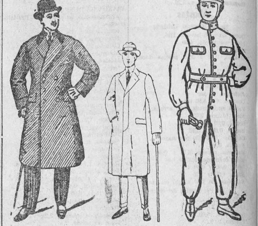
Gabanes col. r. dibujo novedad, a 60, 70, 80, 90, 100 y 125 pts. Corte moderno 1.000 gabanes - 20 modelos distintos Buzos azul y k.ki. a 8, 10, 12, 14, 20 y 23 pts. Precios de fábrica