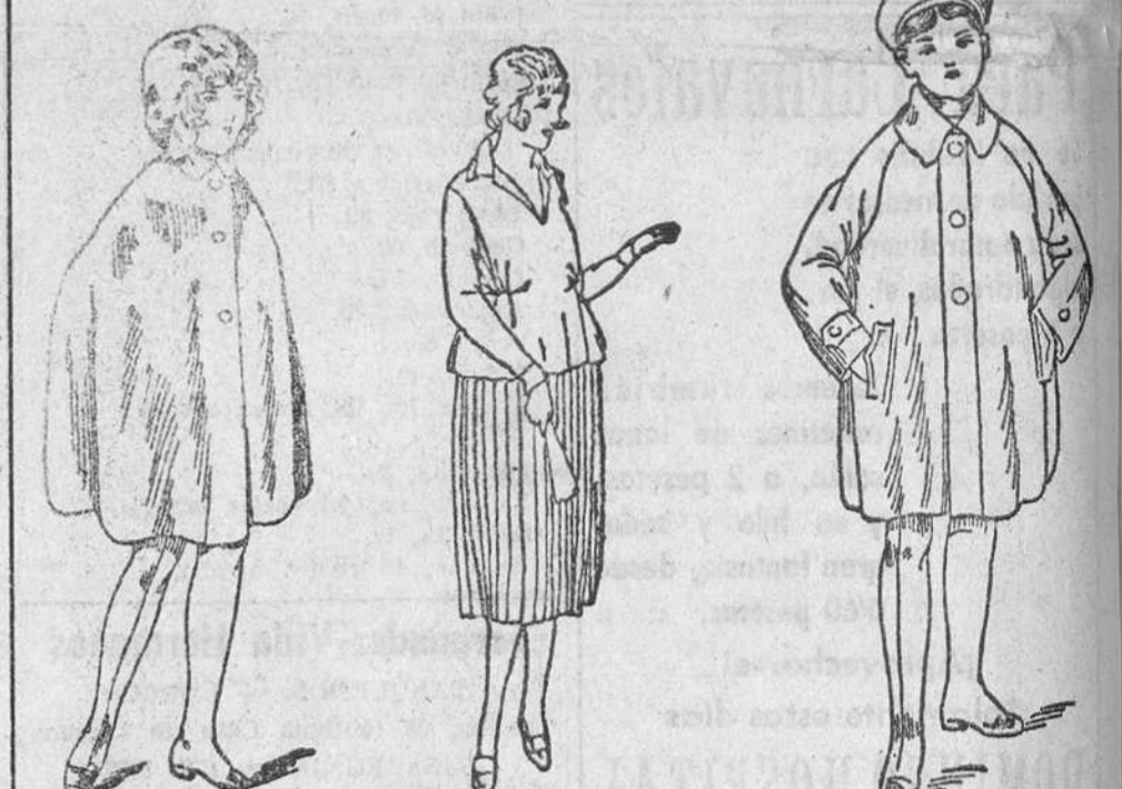
Capas colegiales, en distintos colores, a 8, 9, 10, 12 y 15 pesetas Vestidos para jovencitos en crepon o lana, a 15, 20, 25 pesetas Impermeables checos a 18, 20, 22 y 3 pesetas

La casa que más surtido presenta y más barato vende Siempre grandes existencias encontrarán en la Casa Munguía Plaza Mayor, 42, y Lain-Calvo, 9 y 11.-Burgos