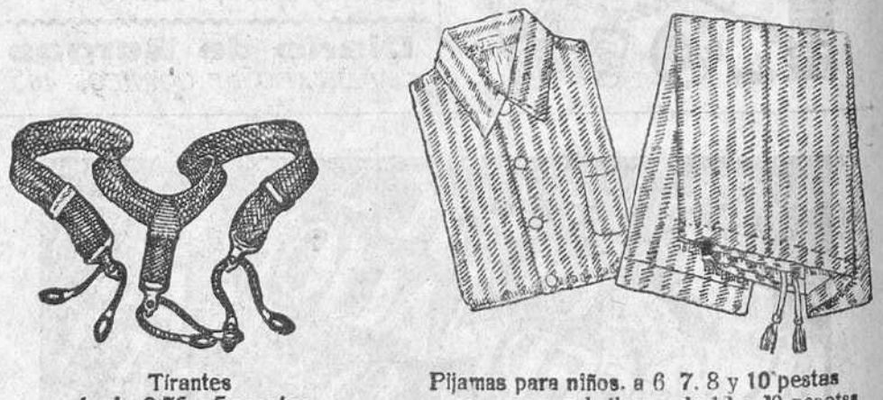
Tirantes desde 0 75 a 5 pesetas Pijamas para niños, a 6 7 8 y 10 pesetas para caballeros, de 13 a 30 pesetas

La casa que más surtido presenta y la que más barato vende. Siempre grandes existencias encontrarán en la Casa Munguía Plaza Mayor, 42, y Lain-Calvo, 9 y 11.-Burgos