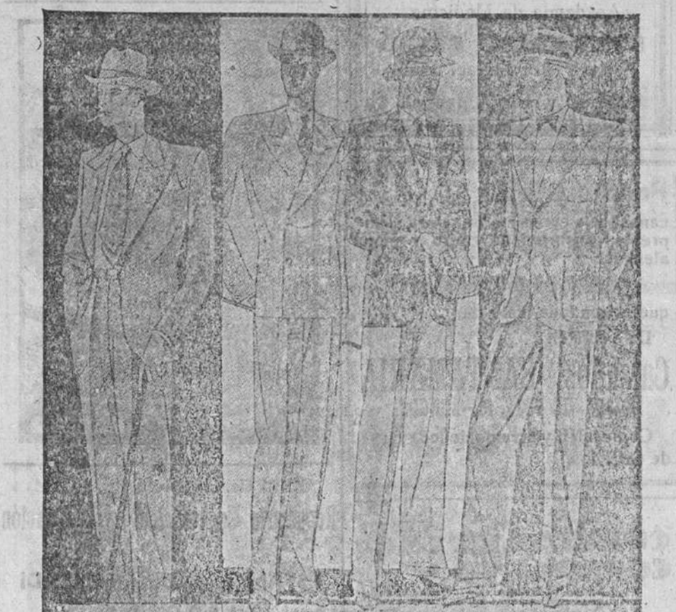
Trajes de paño, confección fina, de 50 a 150 pesetas uno. Corte moderno

Primera casa en confecciones para caballero, señora y niños Plaza Mayor, 42. Lain-Calvo, 9 y 11.-Suncursal: Plaza Mayor, 6, Burgos