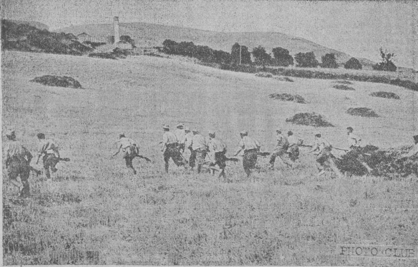
Ataque a un pueblo ocupado por el enemigo