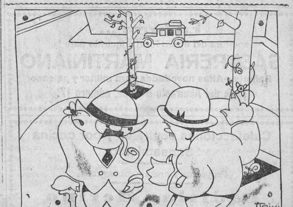
—¡Ja, ja, ja! Qué te tico ayer el decimo que comprate? —Ca; ha sido una confusión de los amigos. Lo que me tocaren fué el «tigres mo».

Interesan las hazañas del primero y conmueven los esfuerzos para ponerlos fin del segundo. Y llega a ser tal la simpatía por ambos, que se duda en desear el triunfo de ninguno, porque se desea el de los dos. Cuando, al fin, sucumbe el uno a manos del otro, admirando al vencedor se compadece al vencido.